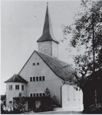
Nordfassade, 1935 mit dem Anbau für die Emporentreppe.