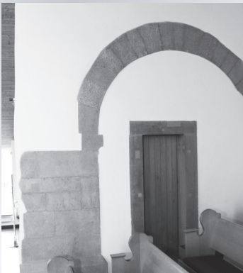
Ältester noch bestehender Teil der Kirche: Chorbogen der St. Niklauskapelle.