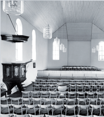
Innenraumansicht, 1971/72 mit nach Norden erweitertem Kirchenschiff (noch ohne Orgel).