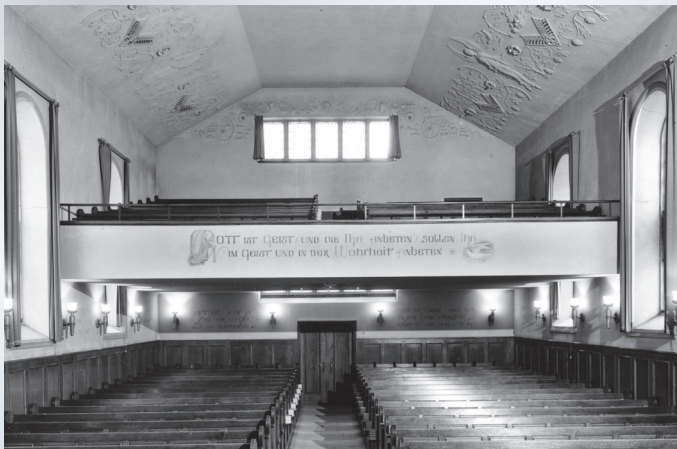
Innenraumansicht, Richtung Norden mit Empore (heutiger Standort der Orgelempore)