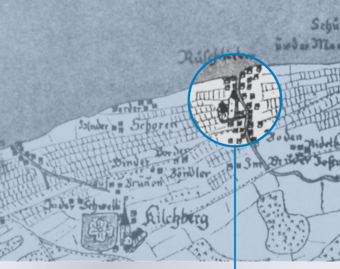
Dieser Ausschnitt aus der «Gygerkarte» von 1667 zeigt die Kapelle St. Nikolaus in einer schematischen Darstellung mit einer Dorfanlage beidseits des Dorfbachs.