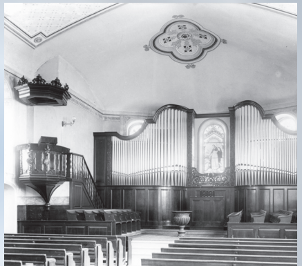
Innenraumansicht, Richtung Süden mit Orgel, die im Jahr 1922 hinzukam. Heute ist dort die Sitzestrade.