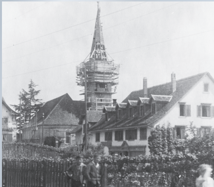
Der steife Spitzhelm wird erhöht und gebrochen, er erhält ein neues Kupferdach, 1926.