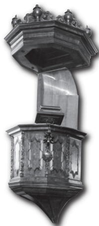
Spätbarocke Nussbaumkanzel, 1714

Die Orgel von 1972 im nördlichen Anbau stammt aus der Werkstatt Neidhart-Lhôte in St. Martin GE.