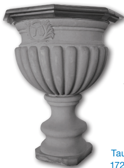
Taufstein aus Sandstein, 1721