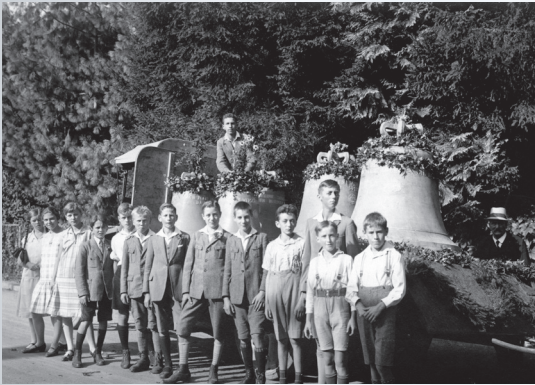
Anlässlich der Glockenfeierlichkeiten war das ganze Dorf auf den Beinen, 4. September 1926.